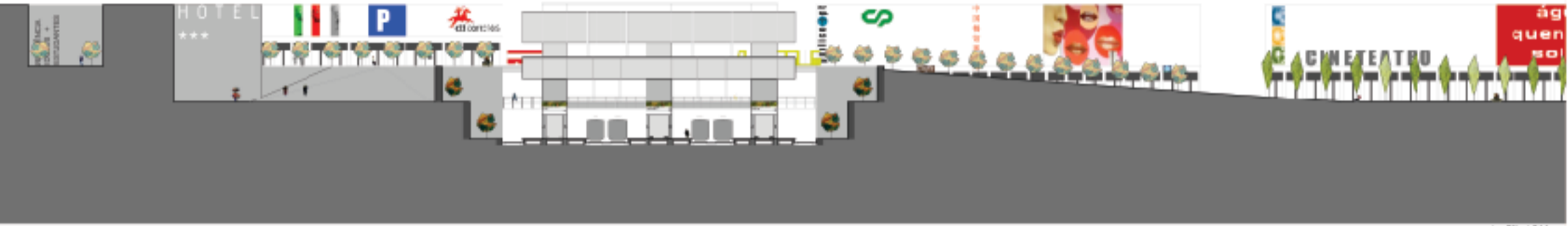
corte E1' 1:500