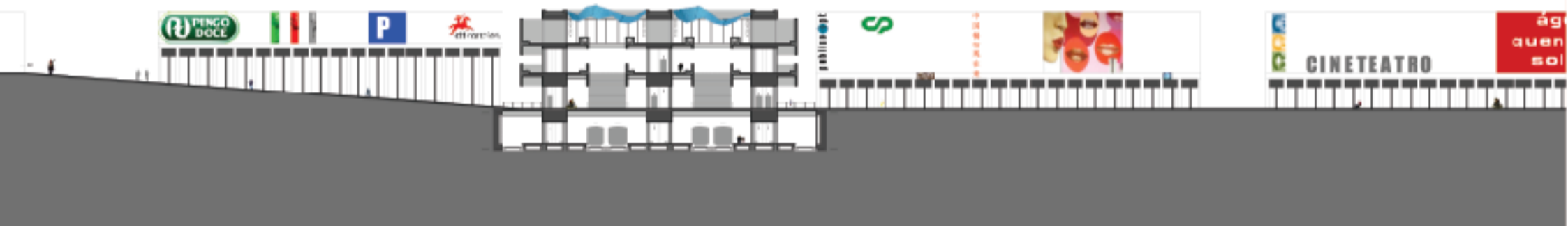
corte F1' 1:500